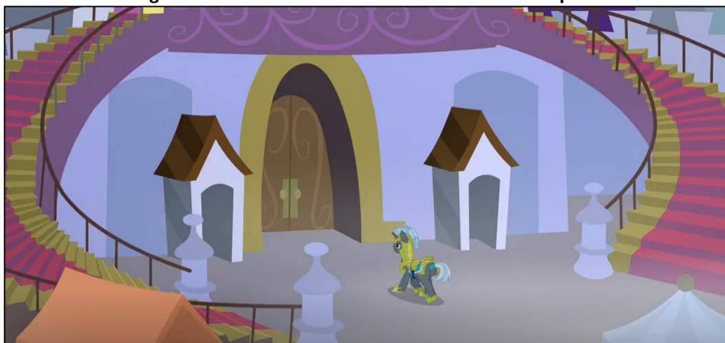
Imagen 22: Exterior de los archivos en la novena temporada

archivo está dentro del castillo de Canterlot, por lo que no es de extrañar que, al ser un complejo tan grande, disponga de varias entradas, que conecten las distintas salas por el interior.