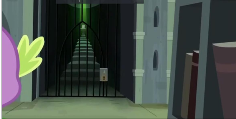
Imagen 5: Segunda sala secreta de la biblioteca del Castillo de la Amistad.