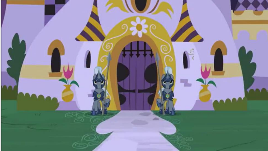
Imagen 19: Exterior de los Archivos de Canterlot en la segunda temporada