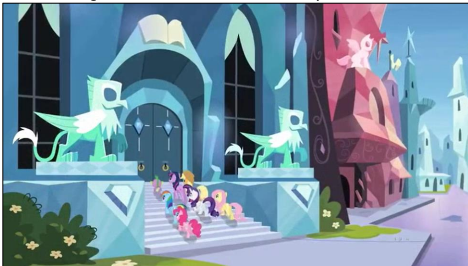
Imagen 9: Exterior de la biblioteca del Imperio de Cristal

El edificio de la biblioteca sigue la línea arquitectónica del Imperio de Cristal, con formas facetadas, piedras preciosas y ventanales. Cuenta con una gran escalinata flanqueada por dos esculturas de grifos que da acceso a un portón doble. El portón presenta un libro tallado en el dintel.