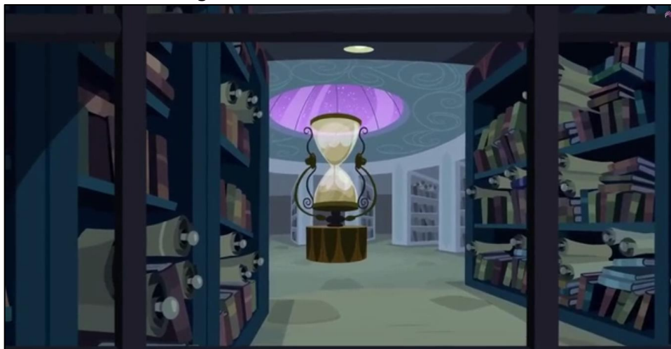
Imagen 21: Interior de la sala de Starswirl