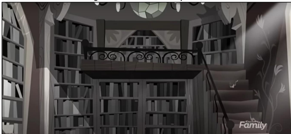
Imagen 18: Biblioteca de Hope Hollow