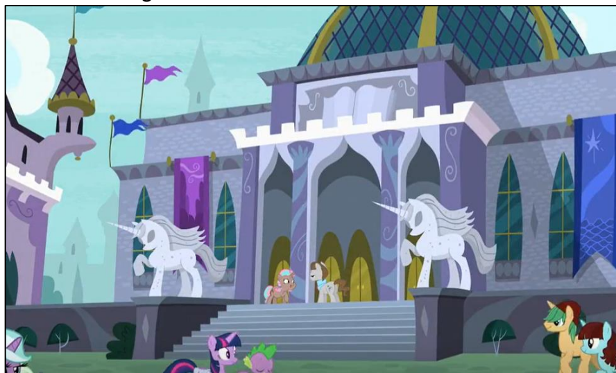
Imagen 11: Exterior de la biblioteca de Canterlot

La Biblioteca de la Magia de Canterlot está situada en la capital del reino de Equestria. Se trata de un edificio imponente, al estilo de un castillo, con una gran escalinata de piedra flanqueada por dos estatuas de unicornio. Cuenta con un pórtico con arcos conopiales, grandes ventanales, y una bóveda en el centro del edificio.