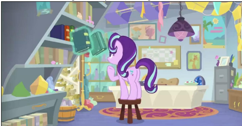
Imagen 16: Despacho de Starlight Glimmer

minerales, cajas, etc. Como ya se ha mencionado, Starlight comienza siendo orientadora escolar, si bien en la novena temporada es nombrada directora de la Escuela de la Amistad. Esta biblioteca podría ser de carácter personal, pero se entiende que es la biblioteca del departamento de orientación escolar y que depende de la Biblioteca General de la Escuela de la Amistad.