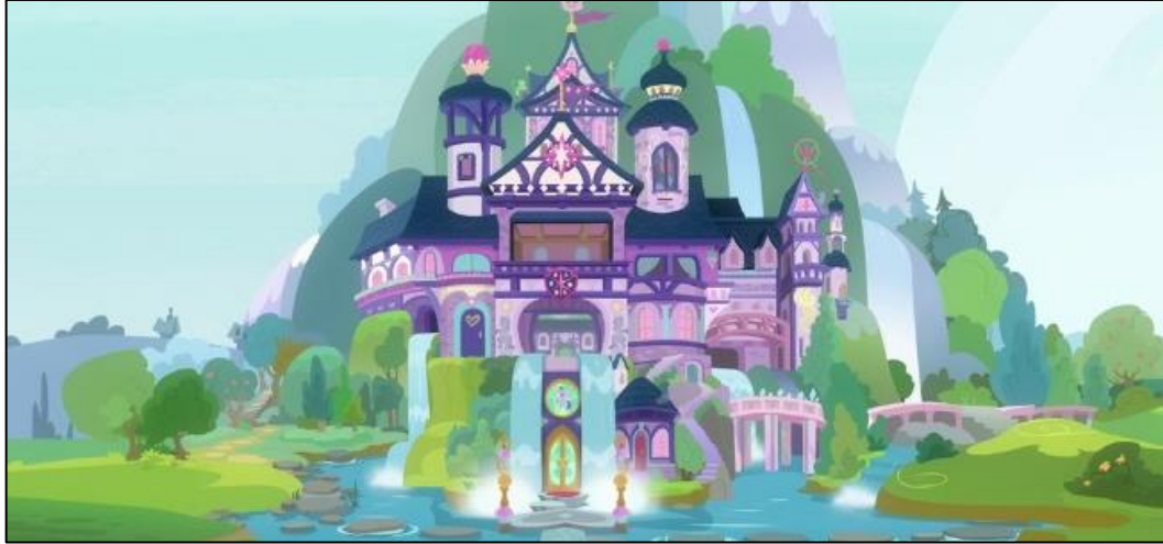
Imagen 13: Exterior de la Escuela de la Amistad