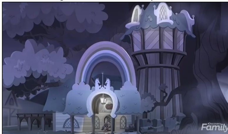
Imagen 17:3 Biblioteca de Hope Hollow