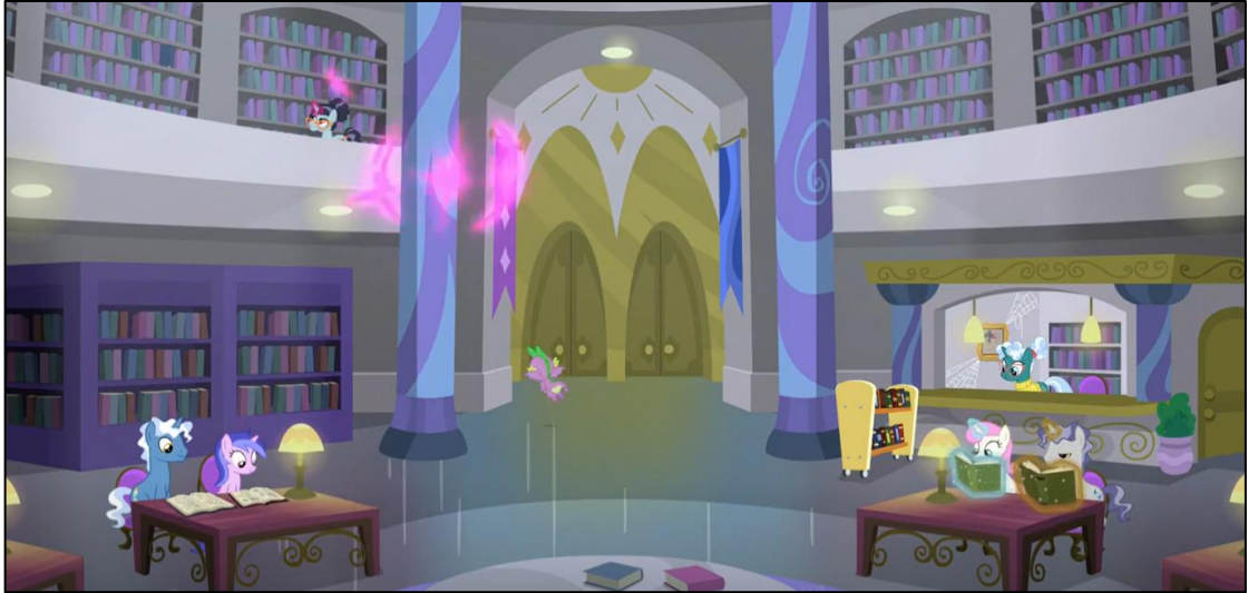
Imagen 12: Interior de la biblioteca de la Magia de Canterlot