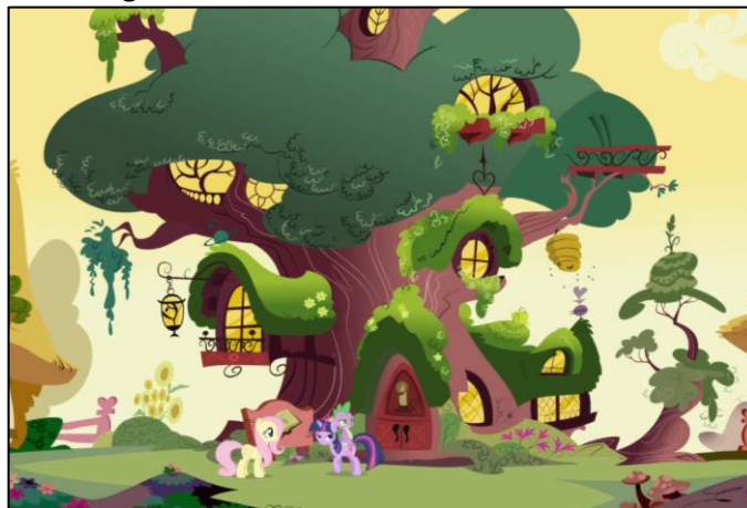
Imagen 1: Exterior de la biblioteca Golden Oak

de ambiente rural. La biblioteca se ubica dentro de un árbol hueco que cuenta con varios niveles de altura. Esta biblioteca sirve también como vivienda de Twilight Sparkle. Su habitación se encuentra en un piso superior, y en el dormitorio también dispone de estanterías por las paredes repletas de libros. En la cima del árbol-biblioteca hay un pequeño observatorio con un telescopio, y se sabe que hay un sótano con espacio de almacenaje.