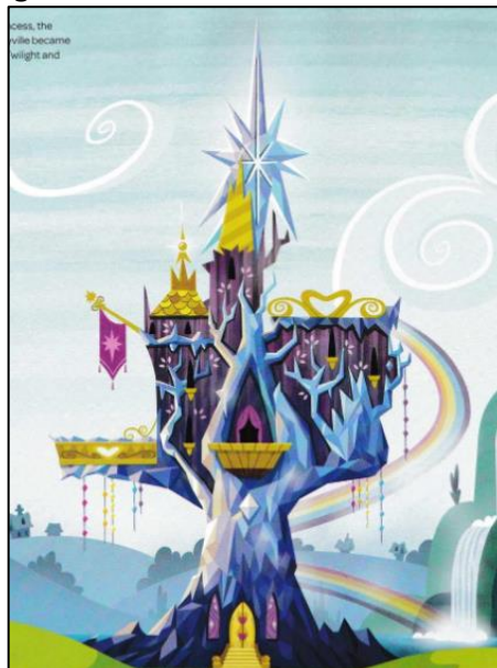
Imagen 6: Exterior del Castillo de la Amistad