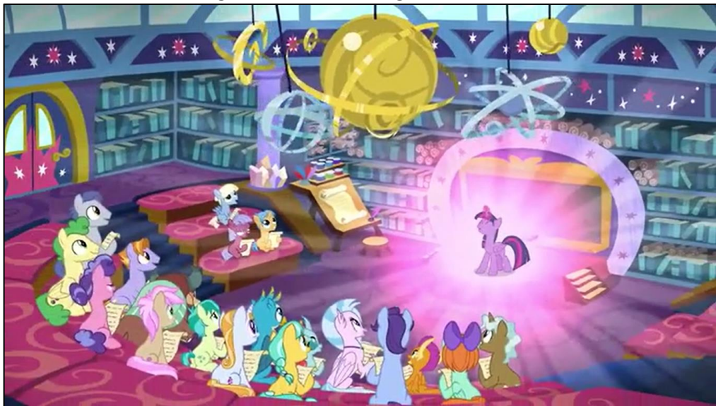
Imagen 14: Aula de Twilight en la Escuela

imparte clase, hay estanterías con libros por las paredes, además de una pizarra, una maqueta de un sistema planetario, y una grada.