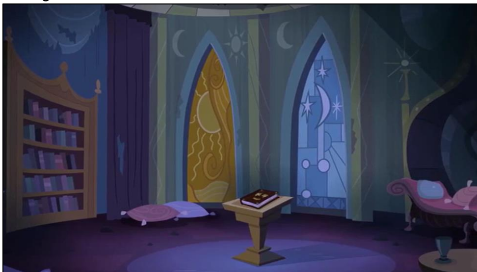
Imagen 4: Primera sala secreta de la biblioteca del Castillo de la Amistad

estantería empotrada con libros, cojines y un diván de lectura. En el centro de la sala, está el Diario de las Dos Hermanas , el diario personal de las Princesas Celestia y Luna, testigo de la historia real.