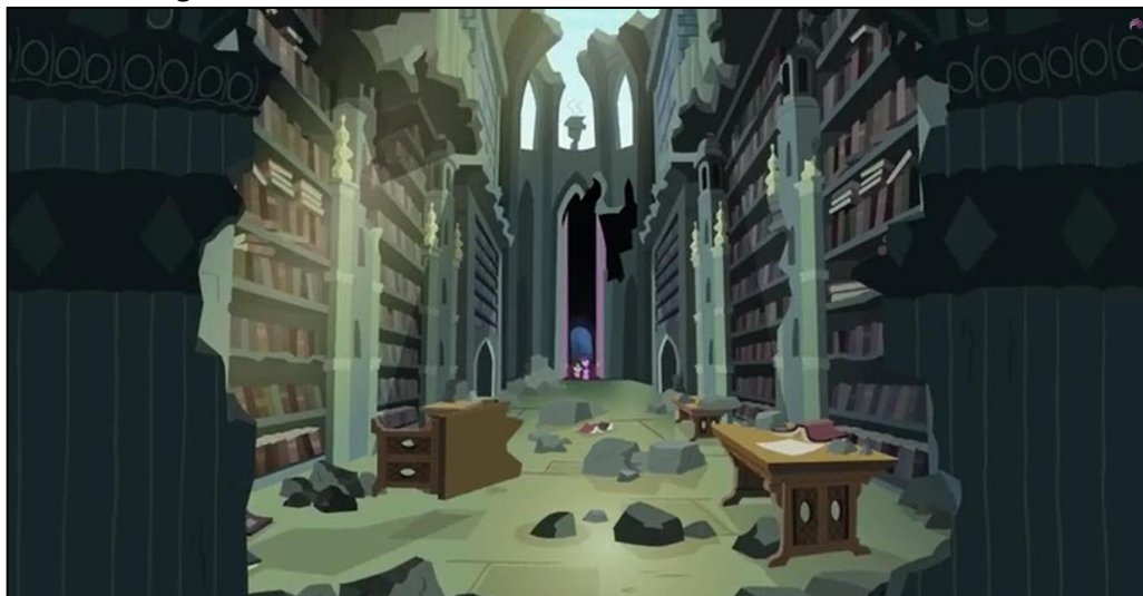
Imagen 3: Interior de la biblioteca del Castillo de las Dos Hermanas.