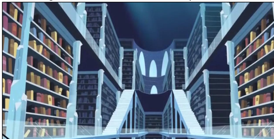
Imagen 10. Interior de la biblioteca del Imperio de Cristal