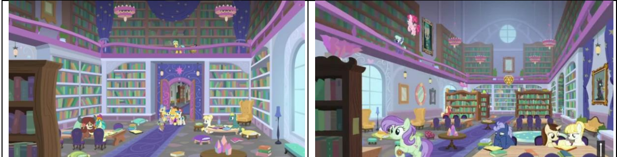
Imagen 15: Interior de la biblioteca de la Escuela